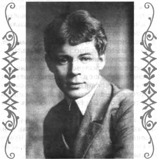
Сергей Александрович Есенин

А х, как бы хотелось верить, что эти неподражаемые строки великого русского поэта Сергея Есенина были навеяны ему во время недолгих прогулок по аллеям Тульского парка, ибо написаны они были осенью 1918 года, той самой осенью,