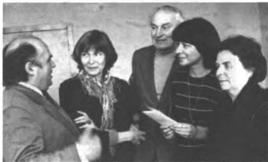
Автор книги с родственниками С.А. Есенина

В конце очерка, как обычно, помещено стихотворение. Его я написал под влиянием эпизода, воспроизведе-